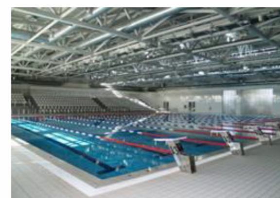
Σεράφειο Δήμου Αθηναίων