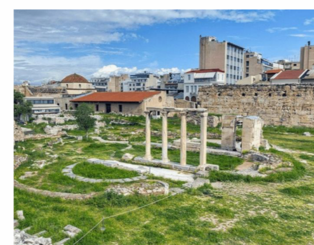
Αρχαία Μνημεία