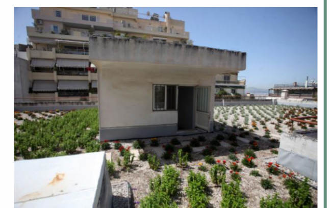
Athens Plans for a greener and cooler city