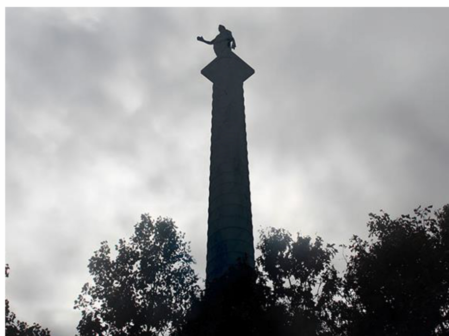
2. Έργο του Μιχάλη Ζαχαριάδη για την πρόσφατη εκκαθάριση της πλατείας Εξαρχείων