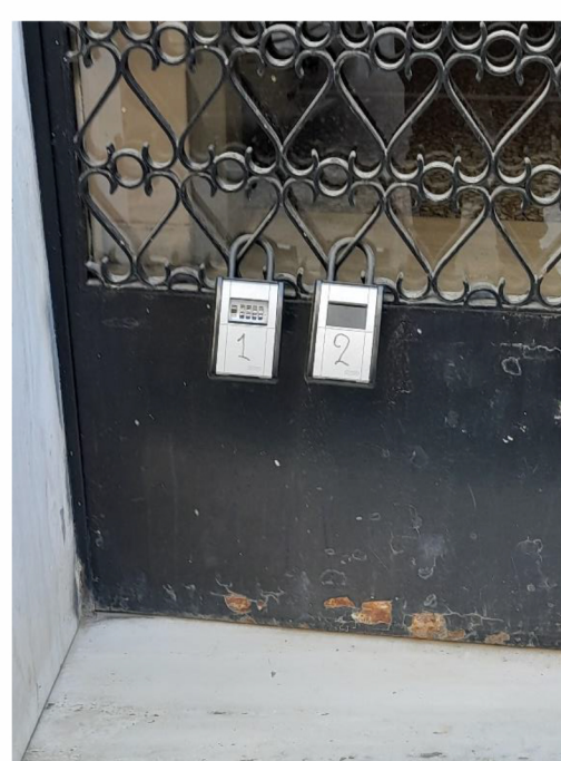
3. Lock Boxes σε τυπική Αθηναϊκή είσοδο