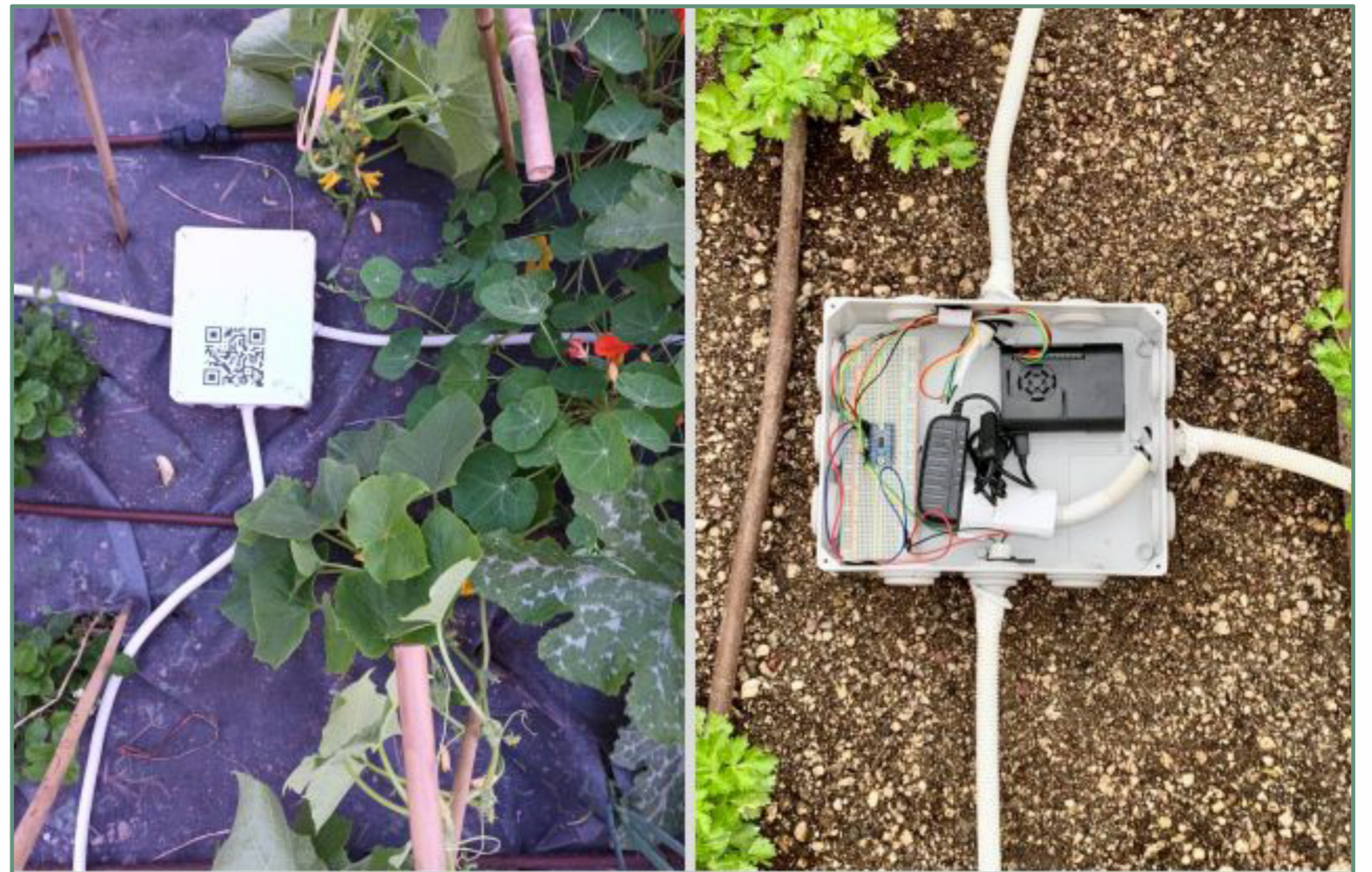
Φωτογραφίες 1 & 2: Έξυπνα συστήματα (Units) στο φυσικό πεδίο