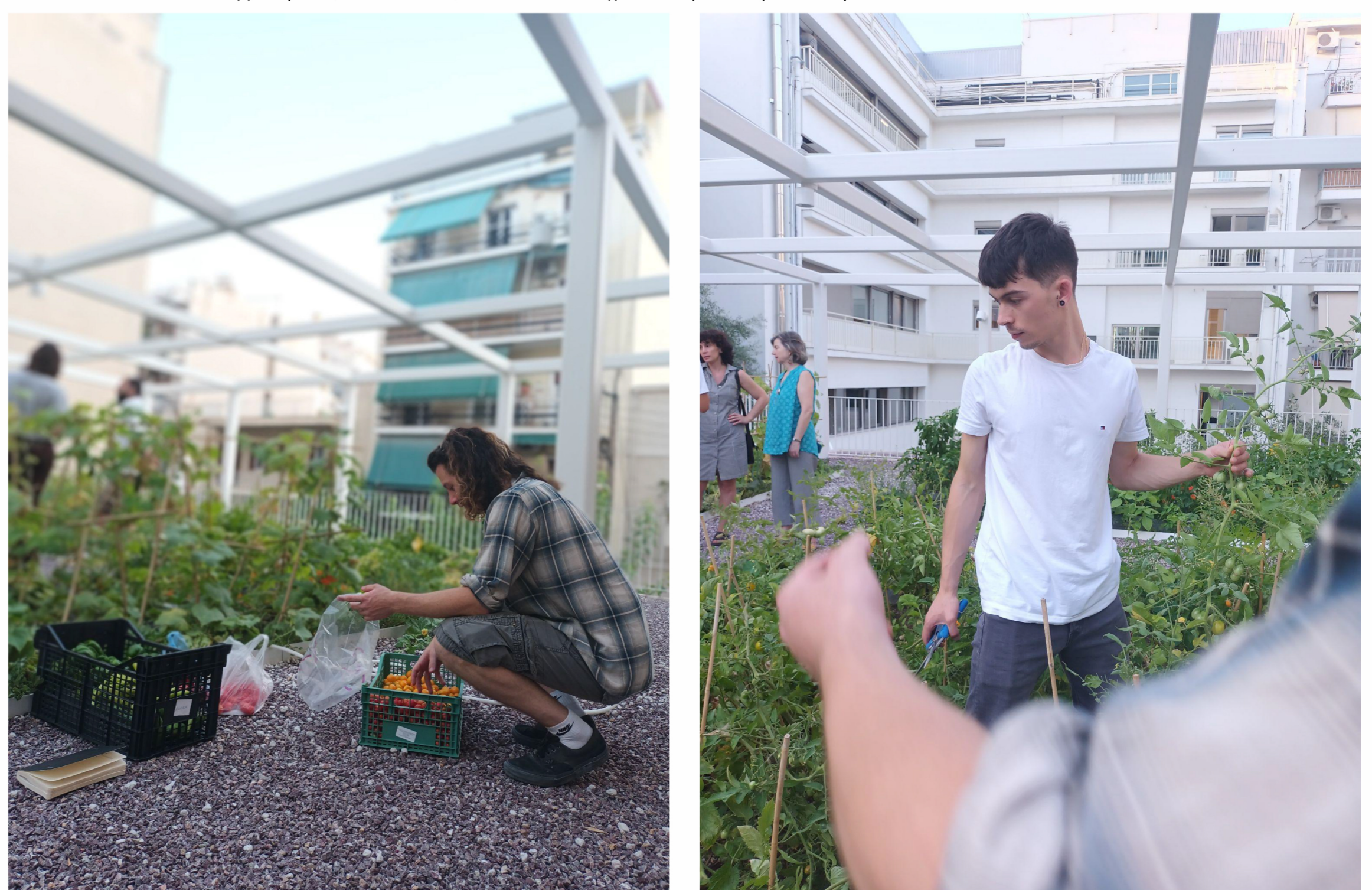
Φωτογραφίες 3 & 4: Αστικοί καλλιεργητές εν δράσει. Συγκομιδή / Επισκέψεις, καλοκαίρι 2023