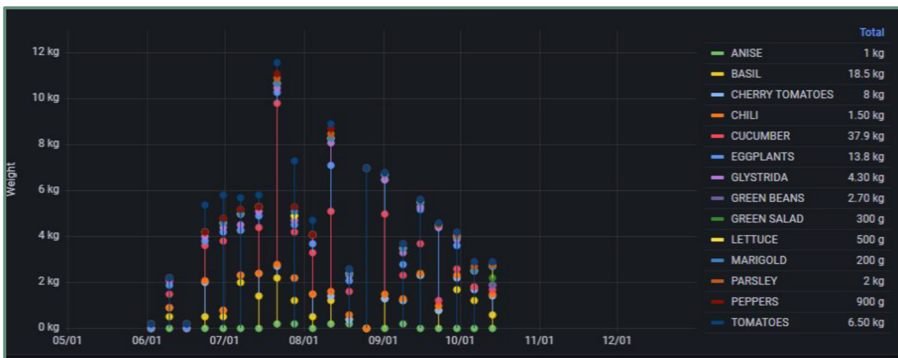
Διάγραμμα 3: Infographic απόδοσης ανά εβδομάδα και είδος (Άνοιξη 2022)