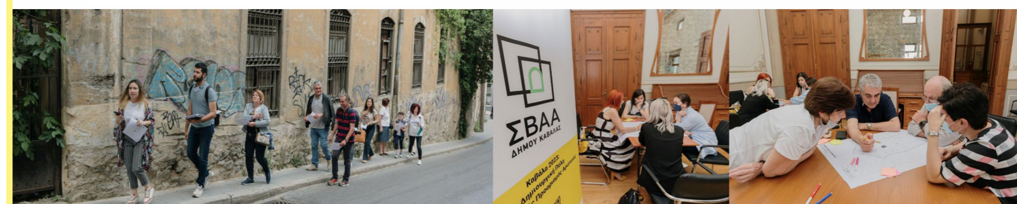
Εικόνες 9-11: Περιήγηση γύρω από το 10 ο ΔΣ και εργαστήριο