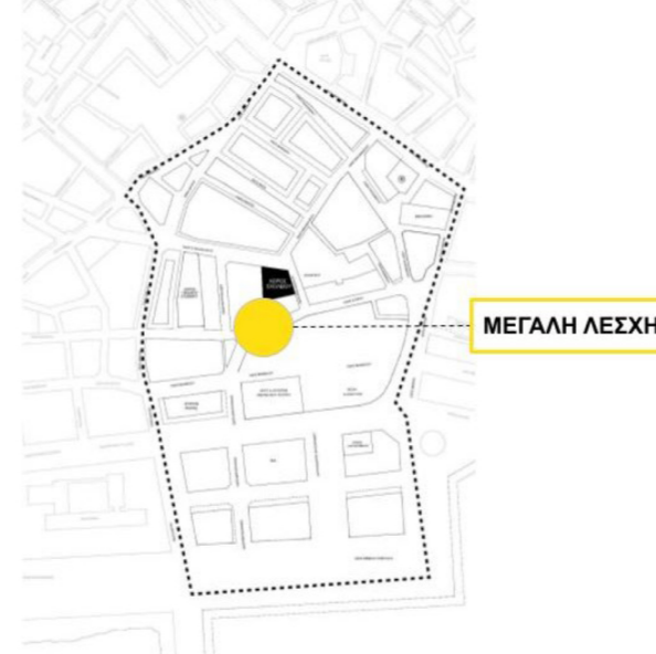
Σχήμα 4: Χάρτης περιοχής μελέτης