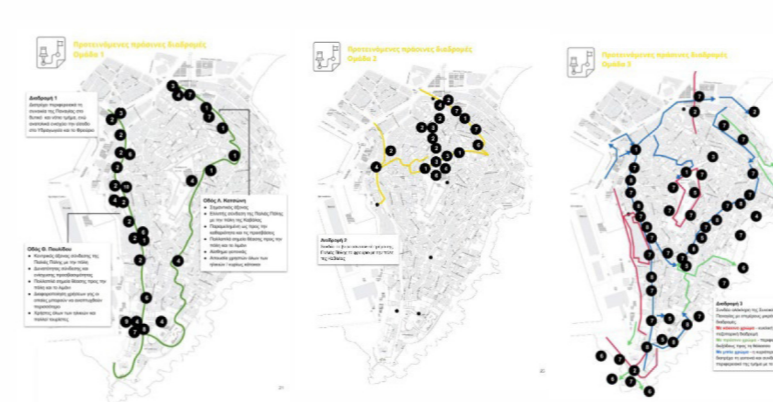
Εικόνες 5-8: Χάρτες προτάσεων