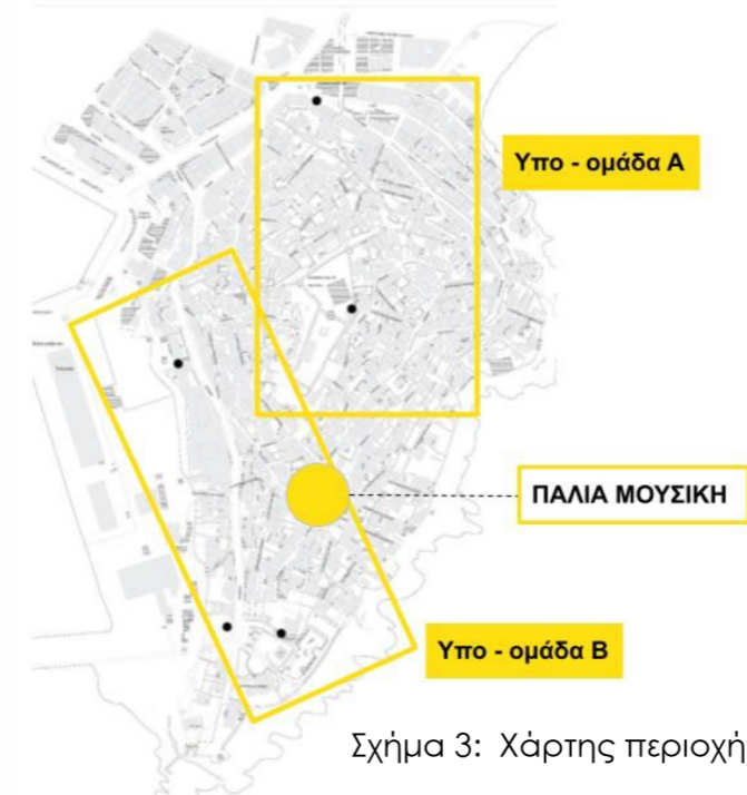
Σχήμα 3: Χάρτης περιοχής μελέτης