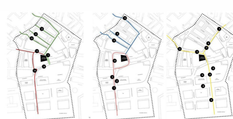
Εικόνες 12-14: Χάρτες προτάσεων