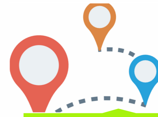
Συν-διαμόρφωση πολιτιστικών διαδρομών