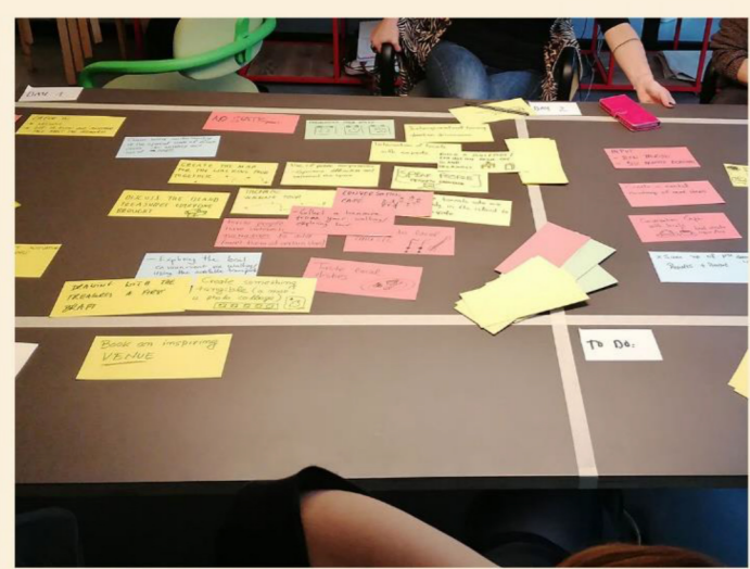
Εργαστήριο συν-σχεδιασμού μεθοδολογίας