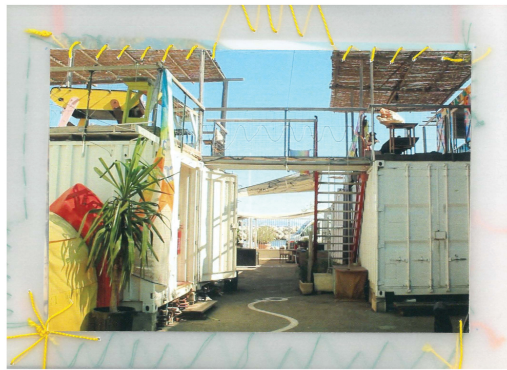
*5 φωτογραφία χώρου

Η εργασία επιχειρεί να καταγράψει το κτίριο του Thalassanté, ενός αυτοδιαχειριζόμενου και συλλογικά κατασκευασμένου χώρου δίπλα στην θάλασσα, στο λιμάνι της Μασσαλίας. Μέσα του στεγαίνει συνεργατικά εγχειρήματα που η δράση τους σχετίζεται με την κουλτούρα της θάλασσας, την κοινωνική αλληλεγγύη, τον πολιτισμό, την οικολογική μετάβαση και τη συμβίωση. Επιθυμεί πάνω απ' όλα να γίνεται σημείο συνύπαρξης των ανθρώπων της γειτονιάς και να αφήνει τις πρακτικές που συντελούνται μέσα του να επαναπροσδιορίζουν συνέχεια την ταυτότητά του. Μέσω της καταγραφής και μελέτης του μπορούμε να διακρίνουμε χαρακτηριστικά που παράγουν αληθινά ποιοτικό κοινό χώρο, ανοιχτό προς όλα τα σώματα της πόλης. Τα αποτελέσματα της έρευνας μας καλούν να επανεξετάσουμε τις μεθόδους παραγωγής χώρου και ευελπιστούμε να εμπλουτίσουν τα αρχιτεκτονικά εργαλεία σχεδιασμού, παρατηρώντας πρακτικές που αναδύονται αυθόρμητα από υποκείμενα της πόλης που συνδιαλέγονται. Η καταγραφή ξεκίνησε κατά τη διάρκεια προγράμματος κινητικότητας Erasmus στην αρχιτεκτονική σχολή της Μασσαλίας (ENSAM). Η οργάνωση του υλικού έγινε στα πλαίσια της διπλωματικής εργασίας στο Τμήμα Αρχιτεκτόνων Μηχανικών (ενιαίος και αδιάσπαστος τίτλος σπουδών Μεταπτυχιακού επιπέδου) του Πανεπιστημίου Θεσσαλίας, υπό την επίβλεψη της Ίριδας Λυκουριώτη.