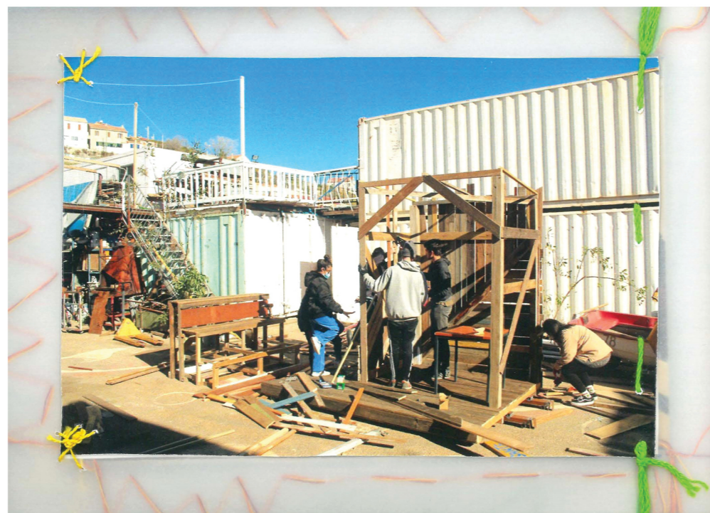
*4 φωτογραφία χώρου

This research is an attempt to document the building of Thalassanté, a self-managed and collectively constructed space by the sea in the port of Marseille. Within it, it houses collaborative projects whose actions are related to social solidarity, ecological transition, symbiotic relations and the sea. Above all, it's hoping to give to the people of the neighborhood a place to co-exist and allow the practices that take place within it to constantly redefine its identity. Through its documentation and analysis, elements that are producing qualitative common space, open to all city's bodies, can be identified. The results of this research inflict the re-thinking of the methods of space production and hopefully enrich the architectural design tools by observing everyday practices that emerge spontaneously from the interaction of its users. The documentation started while attending the Architecture school of Marseille (ENSAM) on an Erasmus program. This body of work is a part of an integrated master thesis at the Department of Architecture of University of Thessaly, supervised by Iris Lykourioti.